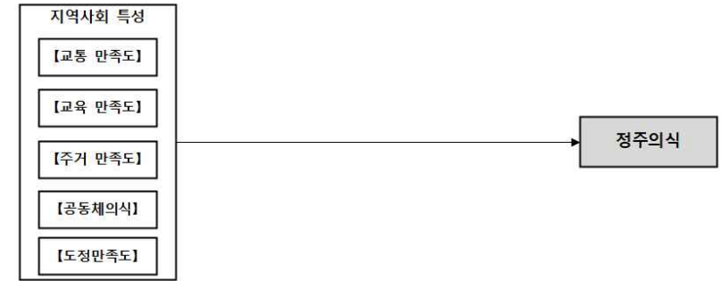
<그림 2> 연구모형

본 연구 모형은 울릉군의 지역사회 특성 중 교통, 교육, 주거, 공동체의식, 도정만족도를 중심으로 구성하였다. 즉, 정주의식에 가장 영향을 미칠 수 있는 요인을 파악하기 위해 교통 만족도, 교육 만족도, 주거 만족도, 공동체의식, 도정만족도를 독립변수로 설계하였고, 종속변수로 정주의식을 설정한 것이다. 따라서 이번 연구 모형은 울릉군의 지역사회 특성과 정주의식과의 영향 관계를 파악하기 위해 다음 <그림 2>와 같이 모형을 설계하였다.